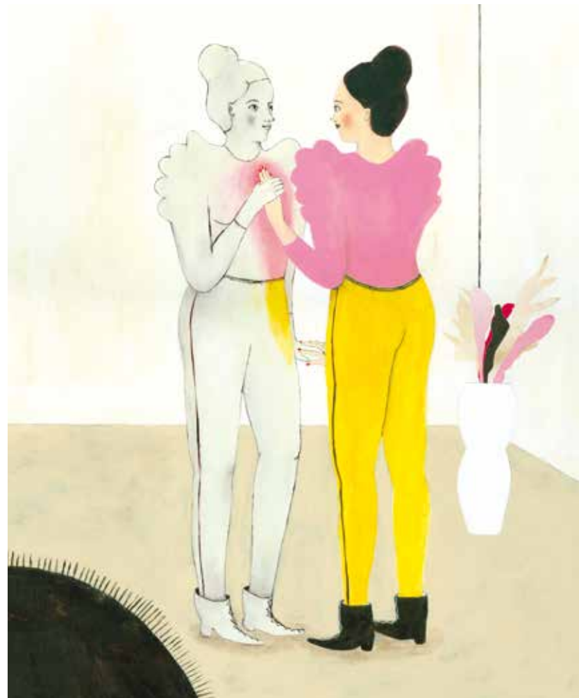
IMMAGINE FESTIVAL LA VIOLENZA ILLUSTRATA 2014

I suoi lavori sono in rete: www.facebook.com/IlustrAutrice www.facebook.com/Anarkikka www.facebook.com/Unchildren